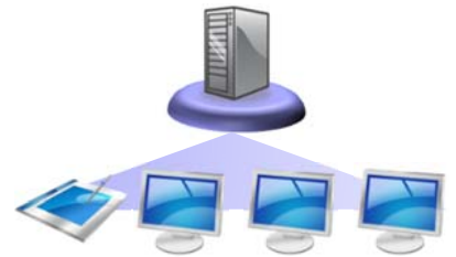
VDI/シンクライアント環境 お客様のデスクトップ環境