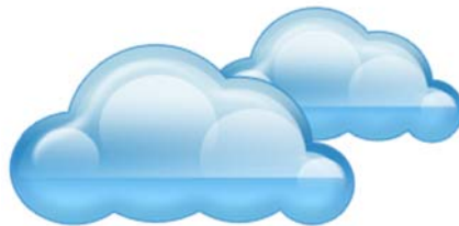
CLOUD i S