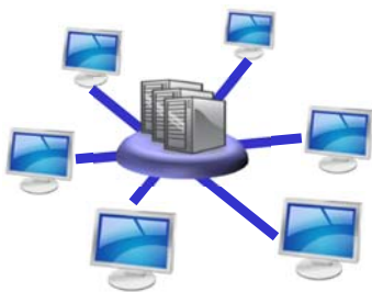
お客様の社内システム